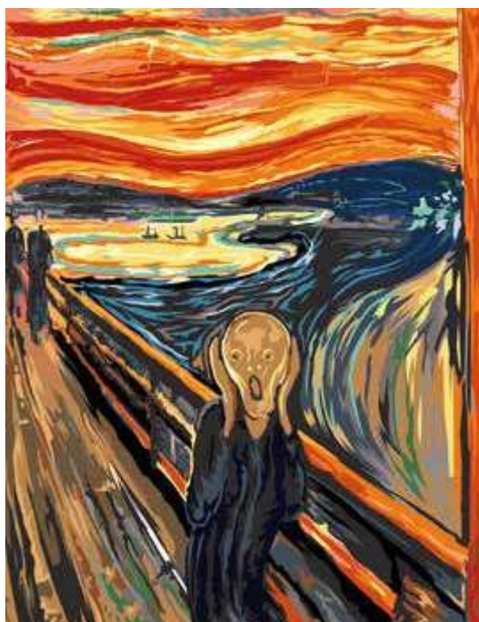
Εντβαρτ Μουνκ, «Η Κραυγή», 1893.

Μία από τις λύσεις που μπορεί να προτείνουν τα παιδιά μπορεί να είναι να ζωγραφίσουν μερικά από τα προσωπάκια – emojis σε κίτρινο ή άλλο χρώμα χαρτόνι ή αν υπάρχει δυνατότητα να ζωγραφίσουν αυτά τα προσωπάκια στο πρόγραμμα ζωγραφικής του λογισμικού (ή κάποιο άλλο όπως το paint/Tux paint) και να τα τυπώσουν. Τα παιδιά όμως μπορεί να προτείνουν και άλλες λύσεις, όπως να κάνουμε ‘ζυμαρένια’ προσωπάκια κλπ. Τα παιδιά ολοκληρώνουν τη ζωγραφική και ο/η νηπιαγωγός συνεχίζει να θέτει ερωτήματα/προβληματισμούς, π.χ πώς μπορούμε να ζωγραφίσουμε τη χαρά; Τη λύπη; Τι αλλάζει όταν ζωγραφίζουμε τα διαφορετικά συναισθήματα; κλπ. Τα παιδιά κάνουν υποθέσεις, π.χ. η χαρά είναι όταν γελάμε, το στόμα μας πρέπει να γελάει...κλπ. Στη συνέχεια τα παιδιά παρατηρούν τις δικές τους ζωγραφιές και των φίλων τους και μπορούν να προτείνουν βελτιώσεις/αλλαγές κλπ. Η δραστηριότητα μπορεί να γίνει ατομικά ή και ομαδικά.