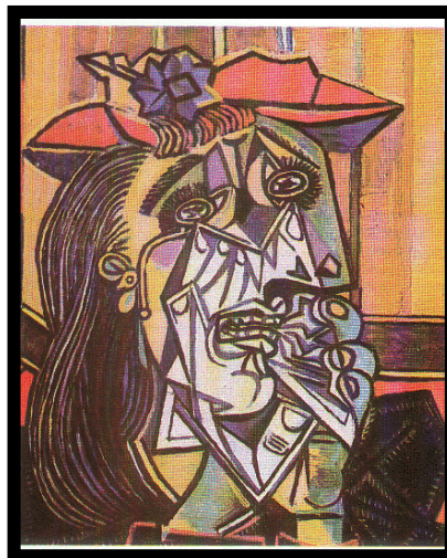
Πάμπλο Πικάσο, « Γυναίκα που κλαίει », 1939.

Ο/η νηπιαγωγός ή και κάποιο από τα παιδιά θέτει το ερώτημα αν μπορούμε να σχεδιάσουμε/ζωγραφίσουμε τα συναισθήματα και ενθαρρύνει τα παιδιά να απαντήσουν και να βρουν τρόπους, να προτείνουν λύσεις πώς μπορούμε να αποτυπώσουμε τα συναισθήματα στο χαρτί ή σε άλλα μέσα. Κατά τη διάρκεια της συζήτησης μπορεί να τους δείξει ή να ψάξουν να βρουν στο διαδίκτυο διάσημους πίνακες από ζωγράφους που έχουν 'ζωγραφίσει συναισθήματα', όπως: