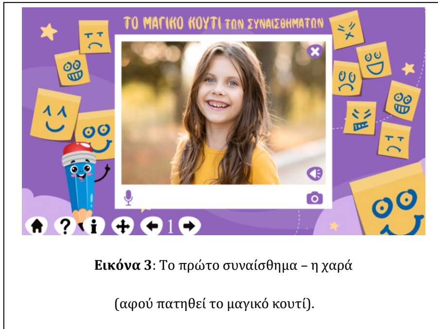
Εικόνα 3: Το πρώτο συναίσθημα – η χαρά