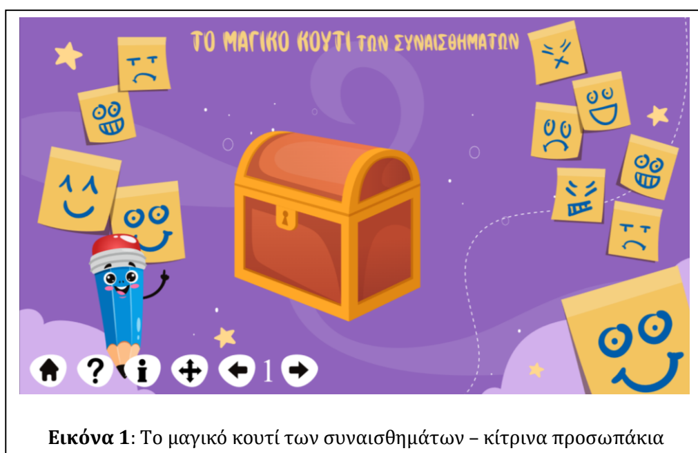
Εικόνα 1: Το μαγικό κουτί των συναισθημάτων – κίτρινα προσωπάκια

Από την αρχή της χρονιάς η/ο νηπιαγωγός παρατηρεί τα παιδιά και χρησιμοποιεί το κατάλληλο λεξιλόγιο συναισθημάτων. Με οποιαδήποτε αφορμή από βιβλία/παραμύθια/διαλόγους με τα παιδιά προσπαθεί να κάνει μικρές ή μεγάλες αναφορές στα συναισθήματα. Αφού τα παιδιά έχουν εξοικειωθεί με το τάμπλετ/υπολογιστή σε μια πρωινή συζήτηση ρωτάει τα παιδιά αν θα ήθελαν να παίξουν με τα συναισθήματα στο τάμπλετ σε ένα νέο παιχνίδι. Ανοίγουν το λογισμικό και πηγαίνουν στη δραστηριότητα για τα συναισθήματα – «Το μαγικό κουτί των συναισθημάτων».